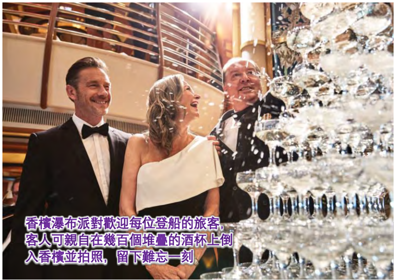
香檳瀑布派對歡迎每位登船的旅客，客人可親自在幾百個堆疊的酒杯上倒入香檳並拍照，留下難忘一刻