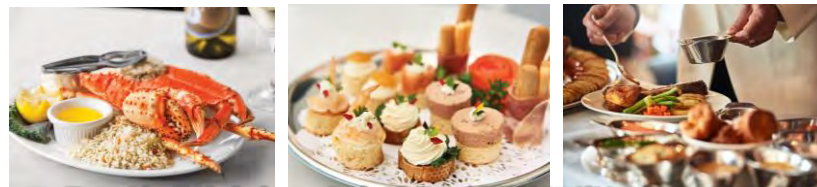
品嚐郵輪「美食」，水療健身及精彩娛樂活動百老匯表演