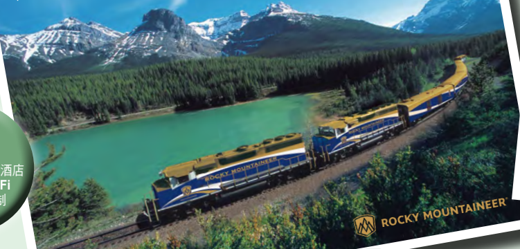
「洛磯山之光」觀光火車