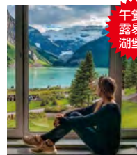
午餐於露易斯湖堡壘

是日早餐自備，繼而前往參觀被譽為洛磯山寶石之露易斯湖，在充裕時間下漫步於湖畔，但見如鏡面一般之湖面倒影著宏偉的山峰和冰川。於露易斯湖堡壘餐廳（包餐團友）享用豐富午餐，真是人生一大樂事。餐後途經幽鶴國家公園內之自然橋返回卑斯省，黃昏時抵達維農。晚餐於當地餐館。（午、晚餐）